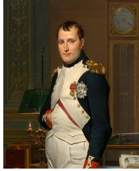
Resim 4: Napoleon Bonaparte

Amerika için ise bu satın alımın sonuçları çok daha büyük ve uzun süreliydi. Amerika Birleşik Devletleri'nin genişliği iki katına çıktı. Öncelikle yeni alınmış arazilere keşif gezileri düzenlendi. Sonrasında batıya doğru yerleşimler de başladı. Bu yeni toprak alımı sayesinde Mississippi Nehrinin de kontrolü tamamen Amerikalılara geçti. Bu nehirde yapılan taşımacılık faaliyetleri sayesinde yurt içine ve dışına ürün göndermek oldukça kolaylaştı. Yeni alınan topraklar aynı zamanda yeni tarım arazileri demekti ki bir süre sonra bu bölge dünyanın tahıl ambarlarından biri haline geldi. Bu gelişmeler sonucunda Amerika Devletlerinde ekonomik ilerleme hızlandı ve toplumun refah seviyesi yükseldi.