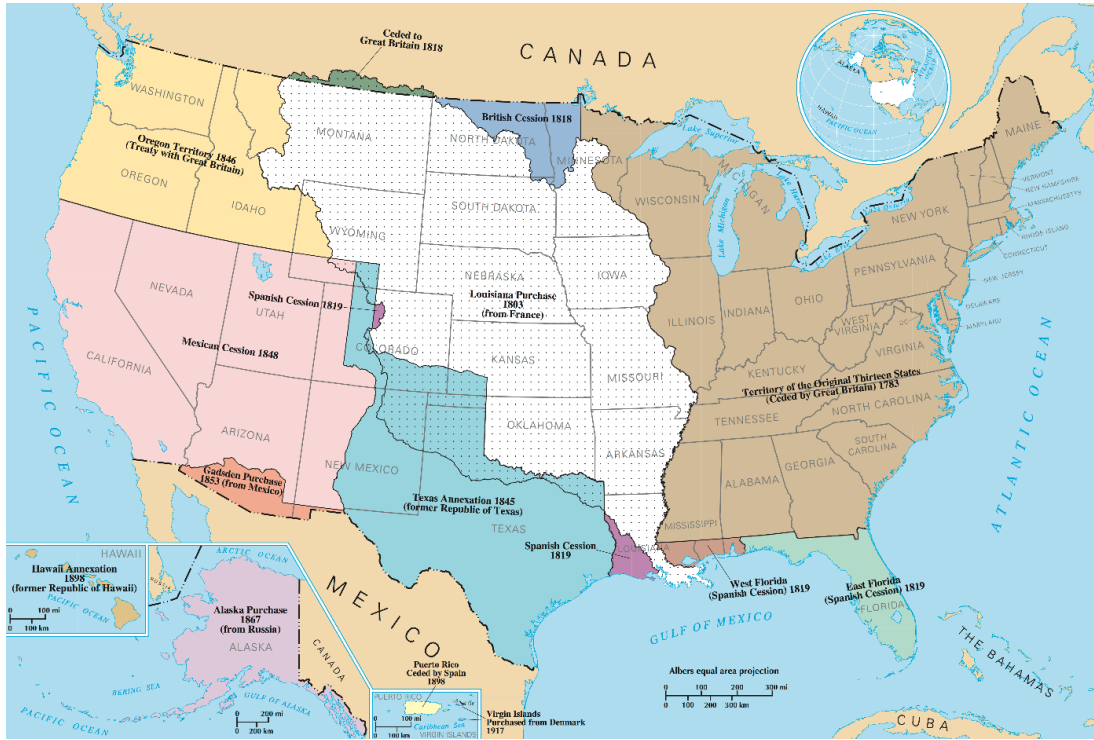
Resim 1: 19. yy başlarında ABD