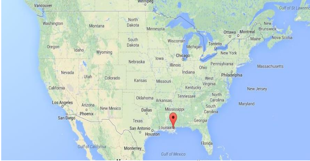
Resim 2: New Orleans şehrinin Amerika kıtasındaki konumu

O dönemde Louisiana ile ne yapılabileceğine hâlâ tam karar vermemiş olan Napoleon, Amerikalıların New Orleans için 10 milyon dolarlık teklifine, bütün Louisiana topraklarını 15 milyon dolara ABD'ye satmayı önerdi. Napoleon böylece pratikte bir işe yaramayan ve aslında tam olarak Fransa'nın bile olmayan toprakları kayda değer bir miktara elinden çıkarmayı amaçlıyordu. Ve aynı zamanda İngiltere'yi istila etmeyi planladığı için ordusuna finansman gerekiyordu. Bu yüzden Amerikan elçileri Monroe ve Livingston'a 15 Milyon dolarlık bir teklif sunuldu. Amerikalı elçiler oldukça şaşırıldılar çünkü teklif edilen alanın satın alımı gerçekleşirse eğer o dönem Amerikasının boyutu iki katına çıkacaktı. Ayrıca 15 Milyon dolar hektar başına oldukça küçük bir meblağ ödeneceği anlamına geliyordu (Britanica, 2019; History, 2019; Monticello, 2019).